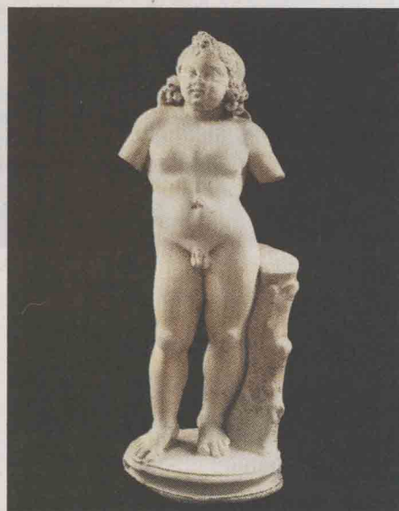
Alt bewährt: der knapp 90 Zentimeter hohe Eros für 136 000 Euro

Ihren Reiz verdankt diese angenehm überschaubare Messe ihrer guten Mischung: Von allem gibt es etwas und von nichts zu viel. Die Preise bedienen ein breites Spektrum, und sogenannte Hochkunst