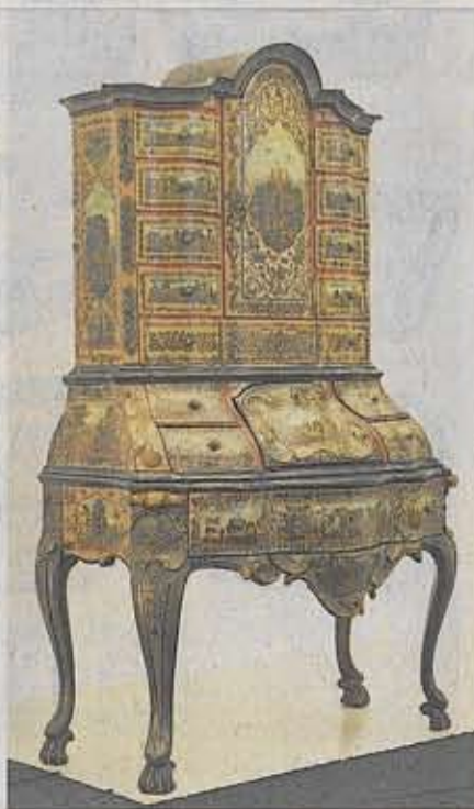
Feiner Sekretär mit „Lacca-Povera“-Fassung bei Daniel Becht (160 000 Euro)

Bis 21. August. Geöffnet von Montag bis Freitag von 10 bis 18 Uhr, am Samstag von 10 bis 16 Uhr, am Sonntag von 13 bis 17 Uhr.