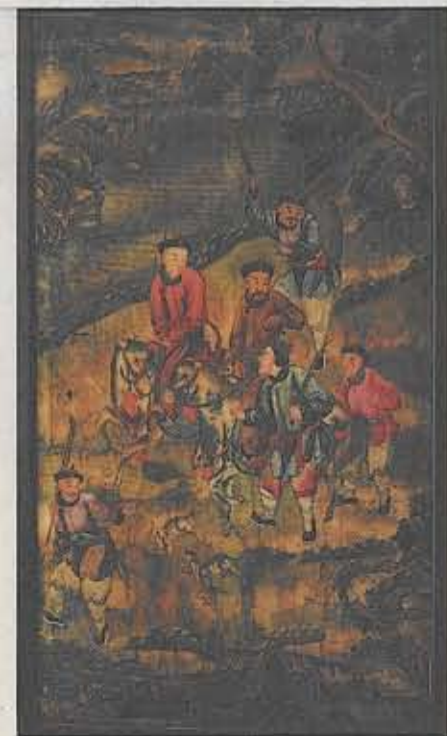
Eine Kanton-Tapete bei Schmidt-Felderhoff (70 000 Euro für das Paar)