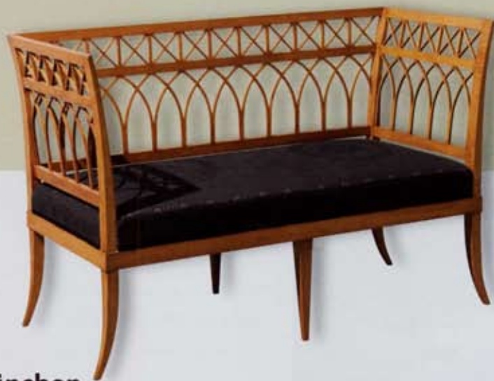
Sitzbank, Süddeutschland, um 1804/05, 86 x 128 x 56 cm; Schlupka, München