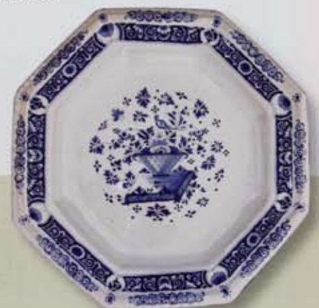
Paar Straßburger Fayence- Platten, 1721/25; Schmidt-Felderhoff, Bamberg