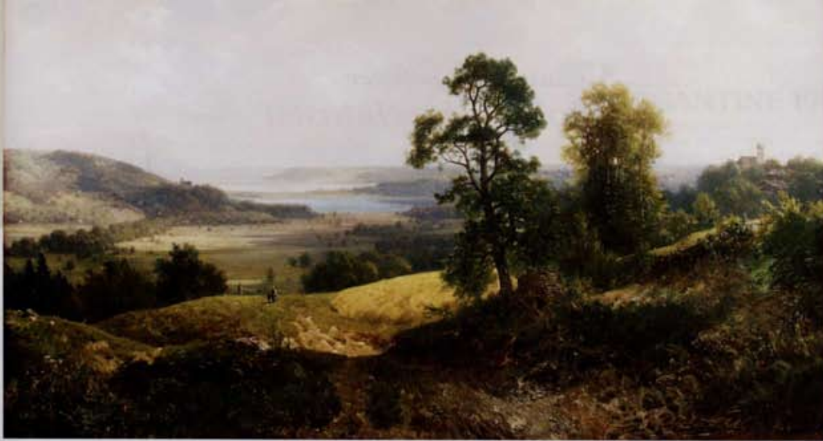
Ludwig von Sckell (1833–1912), Blick zum Ammersee, um 1870, Öl/Lwd., 41 x 73 cm; Kunsthhaus Nüdling, Fulda

Volkskunst: etwa jene Irschenberger Aufsatzkommode bei Sievert oder das Werbeschild einer Münchner Metzgerei bei Pachmann? Vielerlei ähnlich Volkstümliches ist vertreten: Tabakpfeifen bei Herold Neupert, darunter eine spätbarocke Meerschampfeife, oder die Objekte des Kunst- und Wunderkammerspezialisten Peter Wachholz. Ganz anders das Angebot bei Meletta, der Kunst aus den Jahren um 1800 aus England und Frankreich mitbringt: zum Beispiel einen eleganten Sekretär mit Lackmalerei (1760). Womit