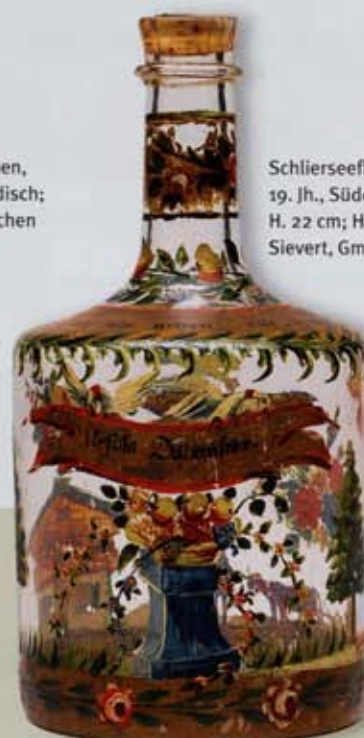
Schlierseeflasche, 1. Drittel 19. Jh., Süddeutschland, H. 22 cm; Hans-Jörg Sievert, Gmund/Finsterwald