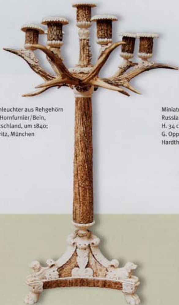
Tischleuchter aus Rehgehörn und Hornfurnier/Bein, Deutschland, um 1840; M. Fritz, München

Weitere Objekte mit Lokalkolorit liefert Helga Ahrend, und zwar „Münchner Kindl“-Schmuck, Anfertigungen aus den 1920er und 30er Jahren mit Steinschnitt und Granulierung. Was wäre diese Münchner Messe ohne die alpenländische