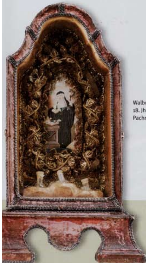
Walburgiskästchen, 18. Jh., alpenländisch; Pachmann, München

78. Kunst & Antiquitäten Paulaner am Nockherberg, München 12. bis 20. April www.kunst-antiquitaeten.de