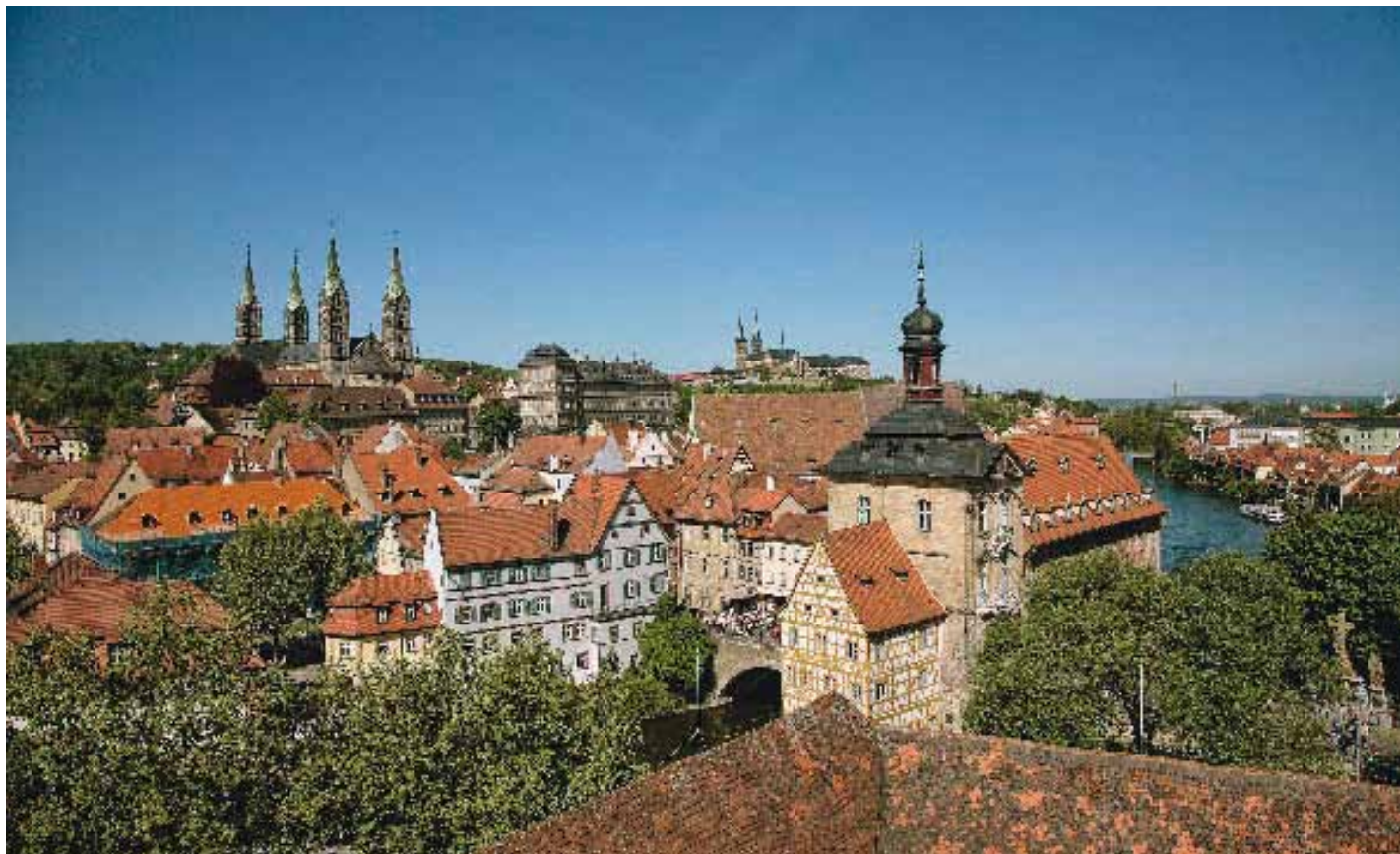
oben: Blick auf Bambergs Altstadt – 1993 wurde sie in die Weltkulturerbeliste aufgenommen, weil sie auf einzigartige Weise eine frühmittelalterliche Stadtstruktur repräsentiert. Bauten aus dem 11. bis 18. Jahrhundert, mittelalterliche Kirchen und barocke Bürgerhäuser prägen die fränkische Kaiser- und Bischofsstadt

Die Bamberger Kunst- und Antiquitätenwochen (23.7.–21.8.) locken wieder mit Preziosen von der Gotik bis heute. Von Susanne Lux