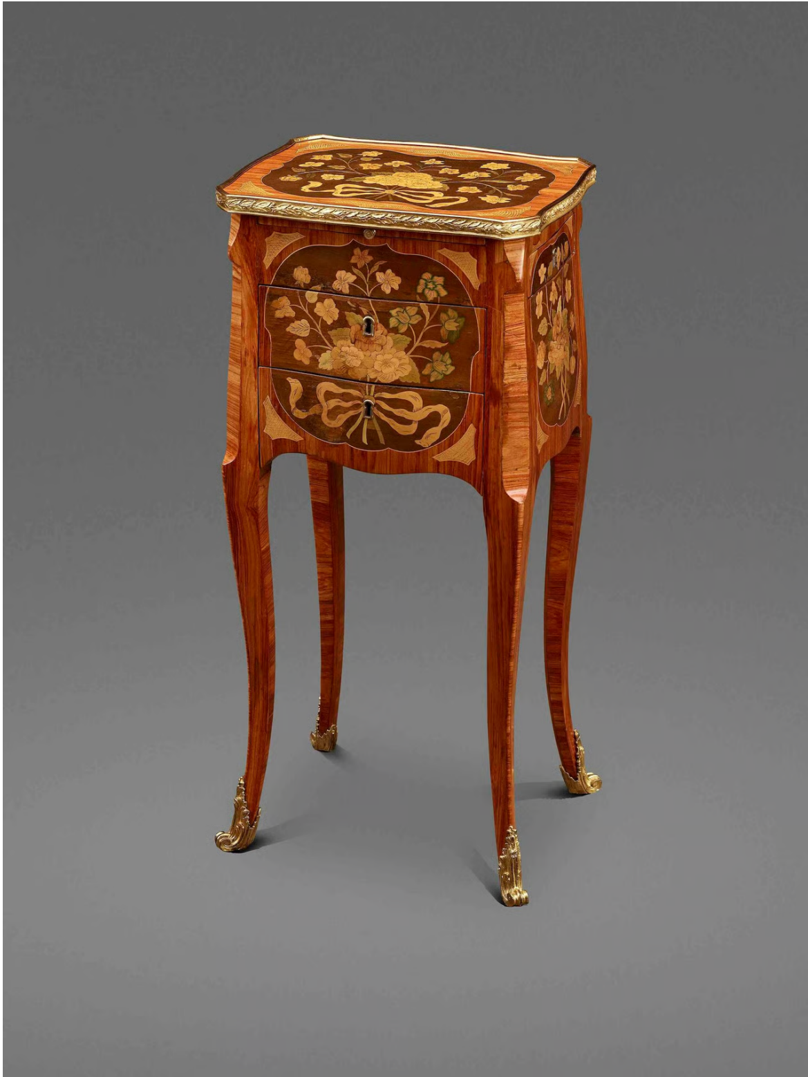
Der höfische Salontisch des Pariser Ebenisten Nicolas Petit von etwa 1765 gehört zu den Spitzenstücken bei Franke. Kostenpunkt: 52.400 Euro.