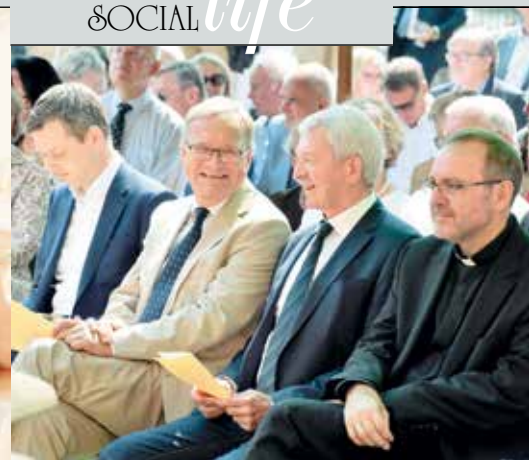
Гости на церемонии открытия в саду Villa Concordia