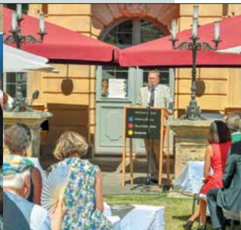
Приветственное слово обер-бургомистра Андреаса Штарке