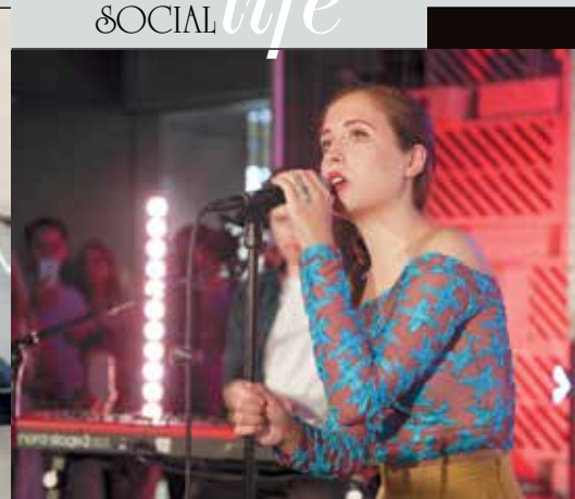
Выступление певицы Элис Мертон стало сюрпризом для гостей