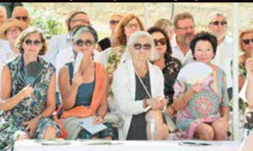
Гости торжественного открытия