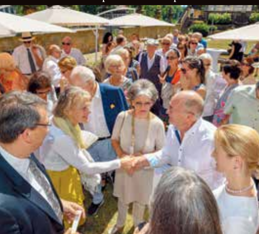
Церемония открытия в саду Международного Дома деятелей искусств Villa Concordia