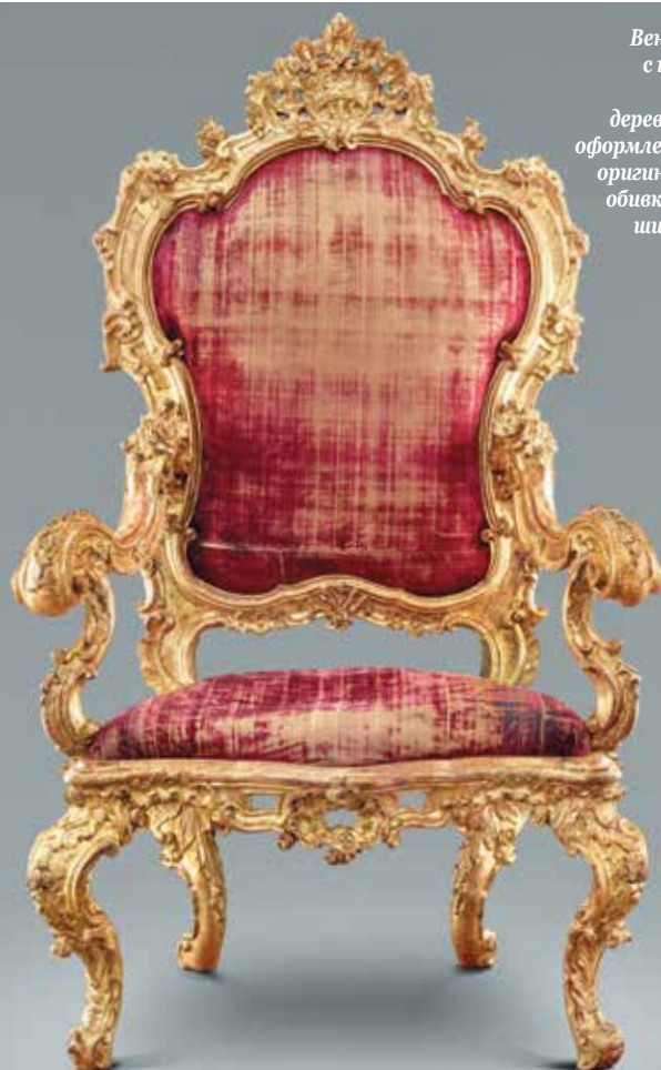
Венецианское кресло с подлокотниками, ок. 1730 г. Резное дерево в оригинальном оформлении с остатками оригинальной шелковой обивки. Высота 136 см, ширина 93 см. CH. E. Franke