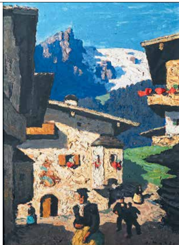
Альфонс Вальде (1891, Оберндорф — 1958, Китцбюэль), «Лето в Тироле». хк./м., 39 x 29 см, оригинальная рама, работа подписана и датирована 1935 г..