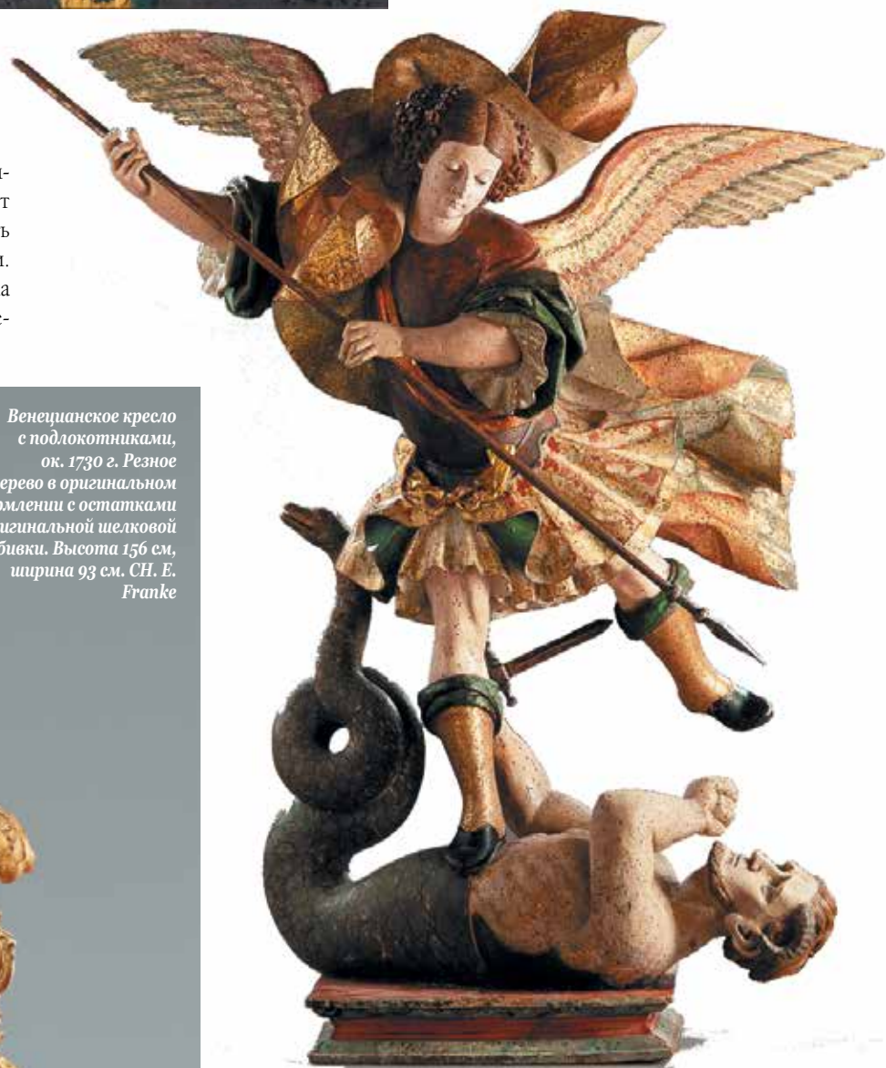
Скульптура в стиле ренессанс «Архангел Михаил — покоритель сатаны», Испания или Неаполитанское королевство, ок. 1560 г. Древесина лиственных пород, полихромная роспись, тончайшая роспись золотом (эстофадо), глаза из стекла. Предположительно оригинальная версия. Высота 102 см. Matthias Wenzel

Галерея Franke Kunsthandel Bamberg , существующая уже более 20 лет, предлагает мебель, созданную на протяжении шести столетий. На двух этажах представлены великолепные творения разных эпох и стилей — от Ренессанса до бидермейера. Здесь также можно встретить редчайшие образцы брауншвейгской барочной мебели. В течение последних лет Franke Kunsthandel предлагает на базе собственной мастерской услуги по реставрации мебели в соответствии с музейными стандартами.